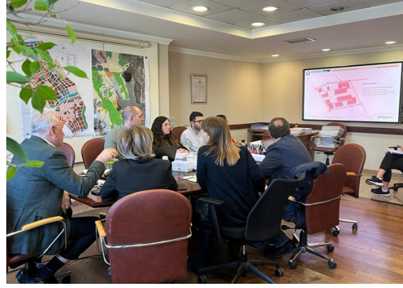
İBB İmar Komisyonu ile yapılan Yeşilkent 1/1000 Ölçekli Uygulama İmar Planı ile ilgili toplantılar