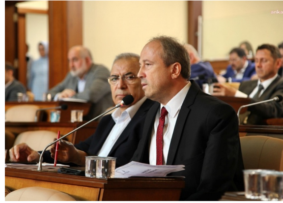
İBB Meclisi Yeşilkent 1/1000 Ölçekli Uygulama İmar Planının onaylanmasına ilişkin kararın verildiği meclis oturumu