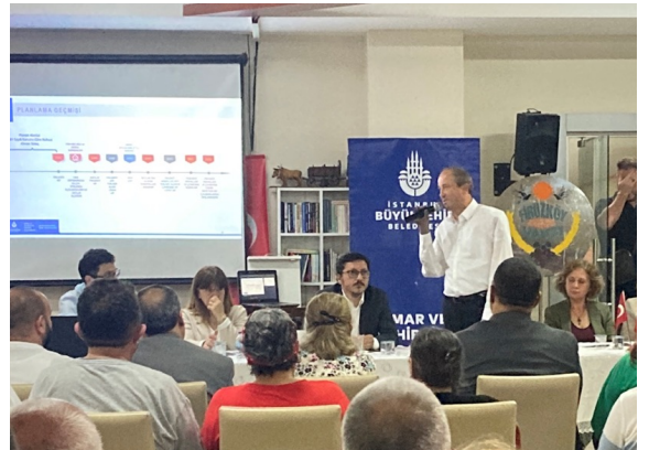
Firuzköy Mahallesi İmar Planı bilgilendirme toplantısı.