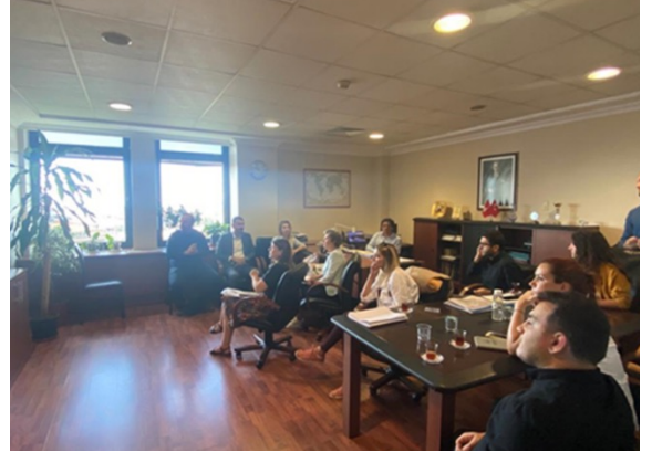
İBB Şehir Planlama Müdürlüğü ile yapılan Firuzköy 1/1000 Ölçekli Uygulama İmar Planı toplantıları