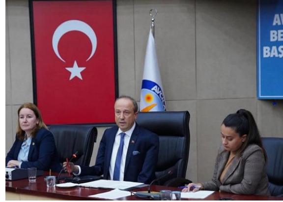
Avcılar Belediye Meclisi Yeşilkent 1/1000 Ölçekli Uygulama İmar Planı itirazlarının değerlendirilmesine ilişkin kararın verildiği meclis oturumu