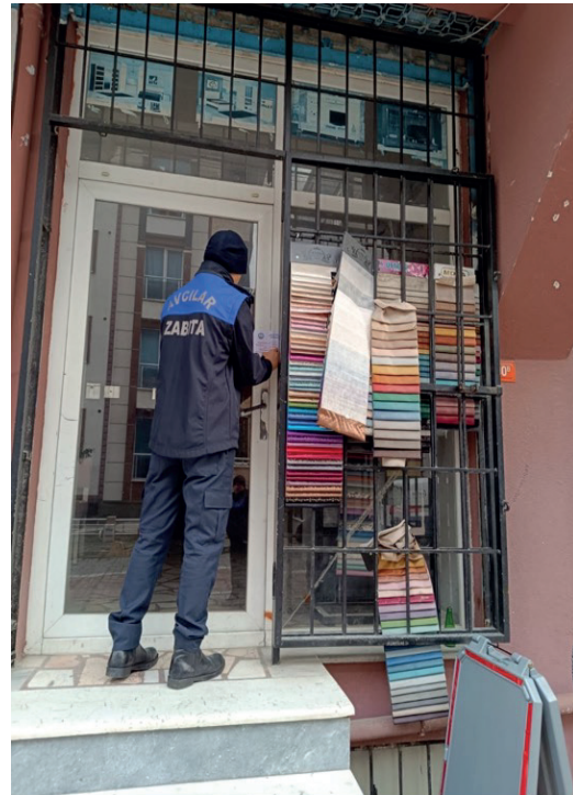
➔ Mühürleme İşlemleri