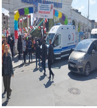
23 Nisan Ulusal Egemenlik ve Çocuk Bayramı