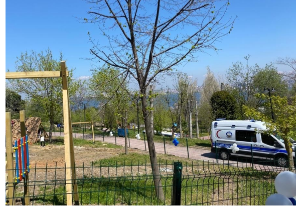
24 Nisan Ekolojik Park Açılışı