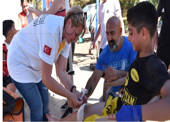
05-06 Ağustos Muhai Thai Şampiyonası