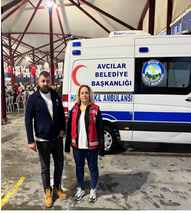
18 Nisan İftar Yemeği

İ. Sağlık personeli ve hasta nakil ambulansı konser, tören, organizasyon, spor müsabakaları, planlı yıkımlar vb. 53 faaliyette görevlendirilmiştir.