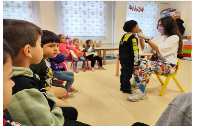
30-31 Kasım Leyla Bayram Anaokulu ve 1.sınıf Dış Taraması

J-GELEN- GİDEN EVRAK TAKİBİ: İdari İşler Şefliği tarafından takip edilen evraklar; kurum içi ve kurumlar arası yazışmalar, defin ruhsatı işlemleri, cenaze bildirim yazışmaları, denetleme raporu evrakları, personelin özlük haklarına ilişkin evraklardan oluşmaktadır.