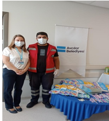
8 Kasım Lösemi Farkındalık Haftasında Çam Sakura Hastanesi Ziyaretimiz