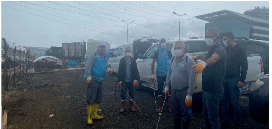
➤ Kurbanlık Alanlarının denetim ve ilaçlanması