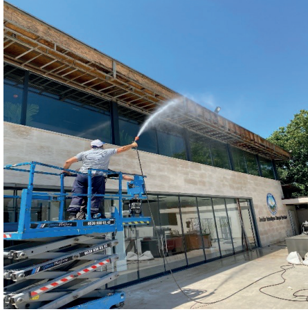
➤ Dezenfeksiyon Çalışmaları