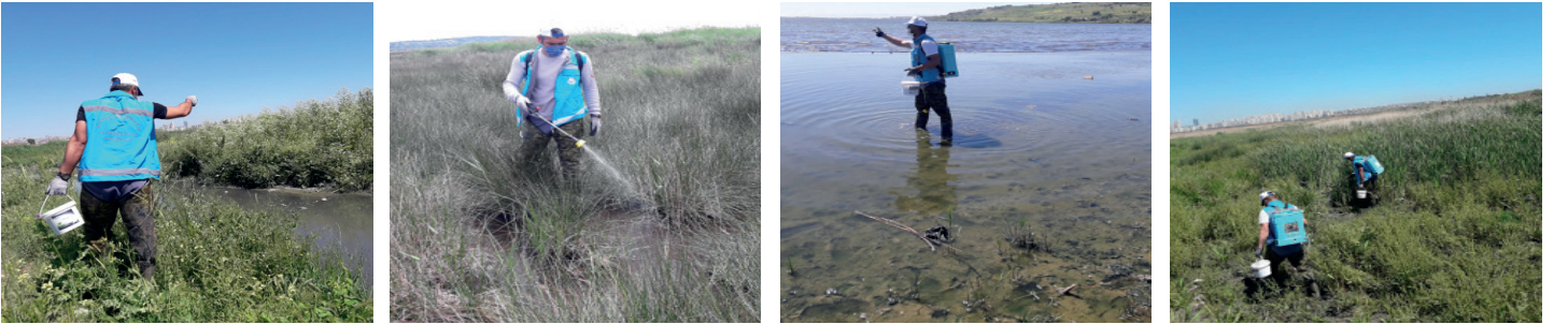
➔ Larva ile Mücadele

İnsan sağlığı üzerinde olumsuz bir tehdit oluşturan, sivrisinek, karasinek, pire ve kene gibi haşeratlara karşı mücadelede, Büyükşehir Belediyesi ile koordineli olarak çalışmalarımız, yıl boyu devam etmiş ve olumlu sonuçlar alınmıştır.