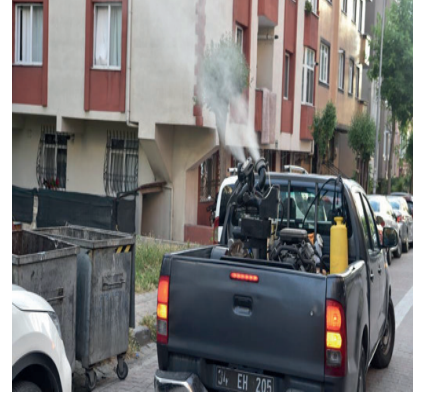
➤ Uçkun ile Mücadele